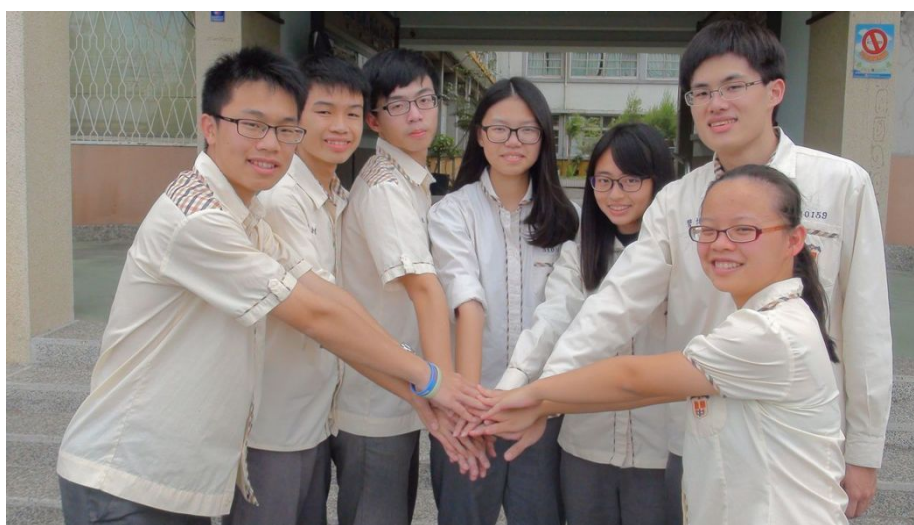
日前大學學測成績揭曉，私立嘉華中學表現不俗，70級分以上學生有5人。